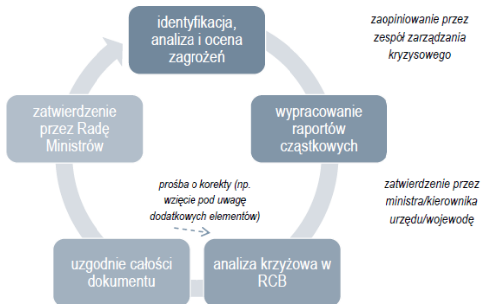
Rysunek 2: Proces akceptacji ryzyka na szczeblu krajowym

Ocena ryzyka jest procesem dwukierunkowym. Najpierw oceny ryzyka są przekazywane przez gminy i powiaty do województw, a następnie przez województwa na poziom krajowy. RCB pełni funkcję instytucji koordynującej przygotowanie krajowej oceny ryzyka. Wojewodowie mają obowiązek opracowywać raporty częściowe i przekazywać je do RCB. Zwrotnie otrzymują informacje w postaci uwag i sugestii. Raporty te stanowią podstawę do opracowania RoZBN. Jednostki niższego szczebla wykorzystują opracowane przez RCB wytyczne dotyczące opracowania raportów częściowych.