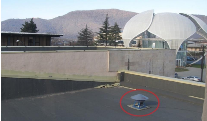
ნახაზი 4 – სირენა ყვარელში